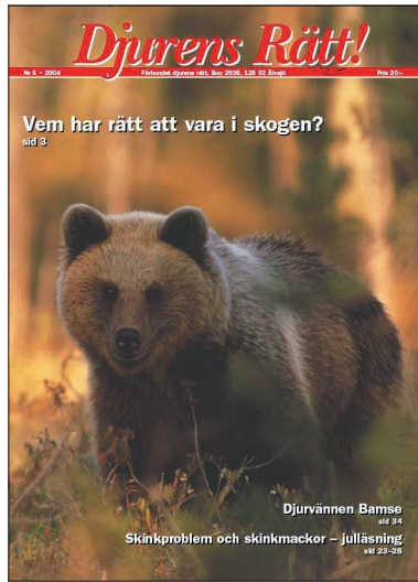
GAMLA. Omslag samt debattuppslag.

Jämförelse av omslag samt uppslag från gamla respektive nya tidningen.