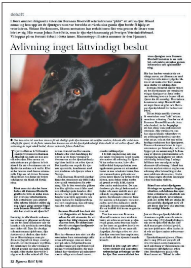
GAMLA. Omslag samt debattuppslag.