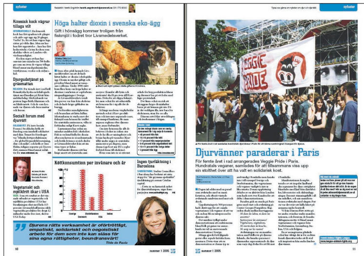
PROTOTYP. Uppslag, delvis med gamla numrets nyheter från den första prototypen. Används som underlag vid diskussioner.