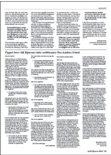
GAMLA. Omslag samt debattuppslag.