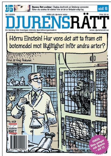
NYA. Omslag samt nyhetsuppslag.