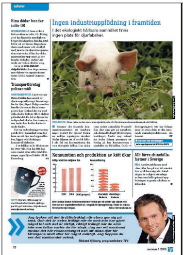
NYA. Omslag samt nyhetsuppslag.