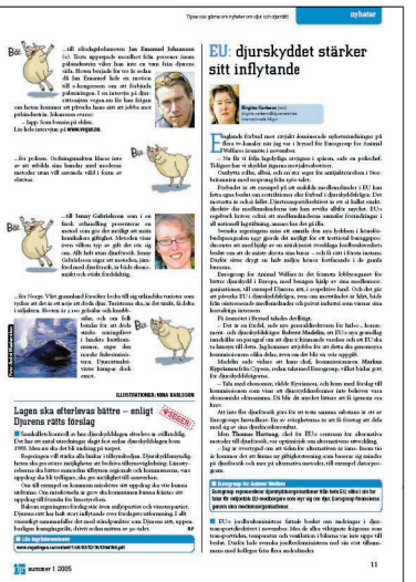
NYA. Omslag samt nyhetsuppslag.